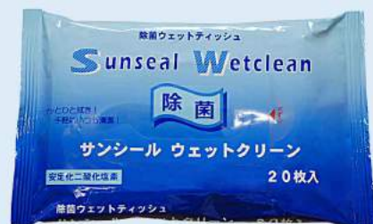
サンシールウェットクリーン